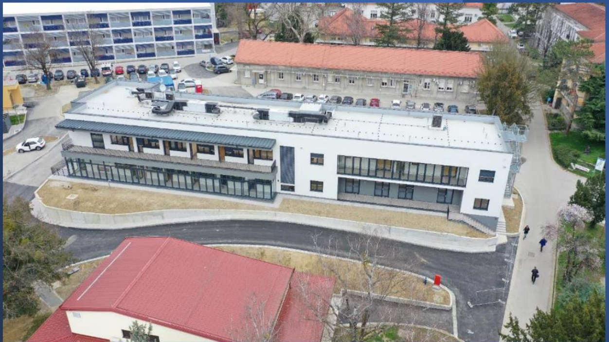
Obnova objekata Klinike za infektivne bolesti "Dr. Fran Mihaljević"